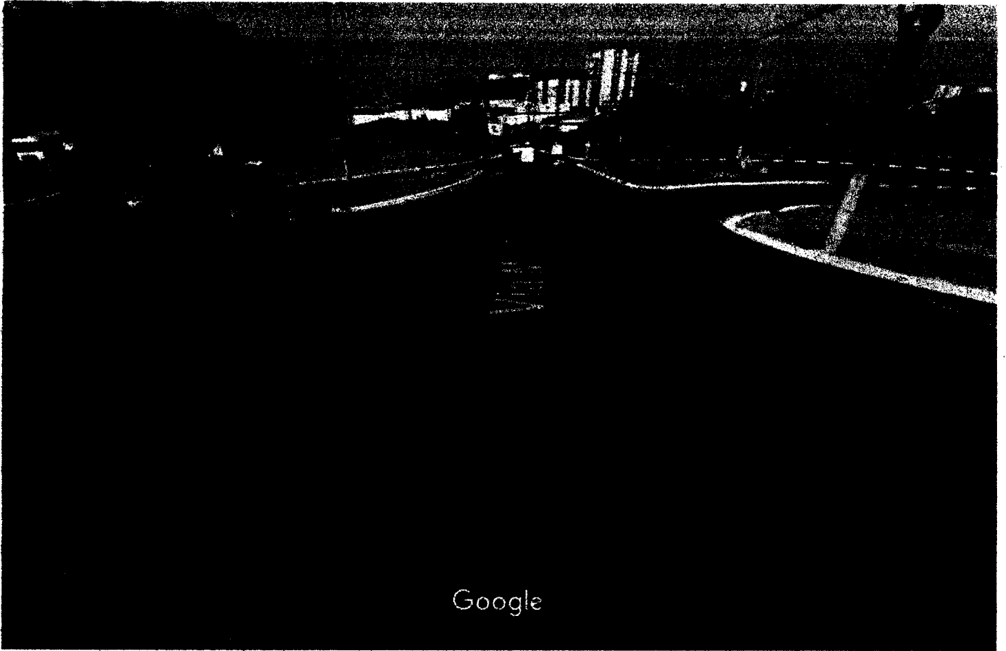
Captura da imagem: set 2015