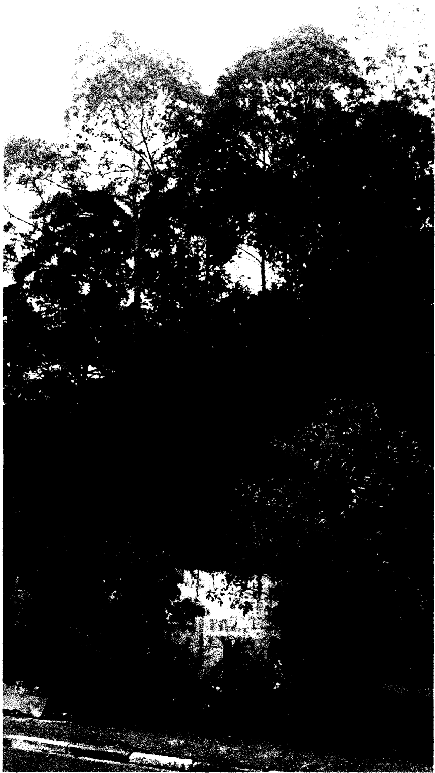
Rua Cícero Moura Tavares em toda sua extensão.