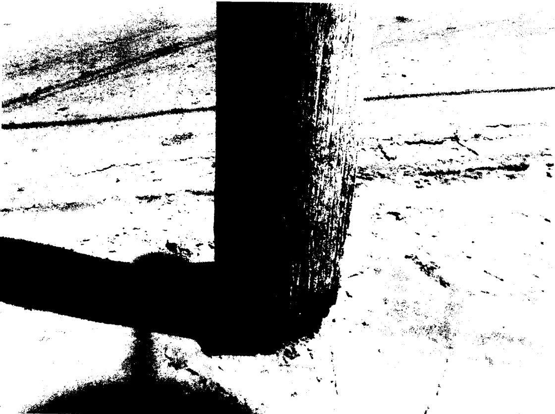
Rua Duque da Costa 200