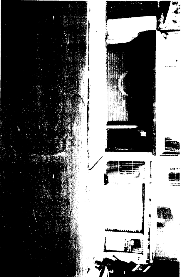
RUA OLGA, Nº 335 - Pq. DOS CAMARGOS