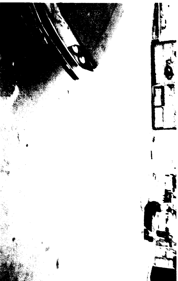
RUA VANDA, Nº 15 - Pq. DOS CAMARGOS