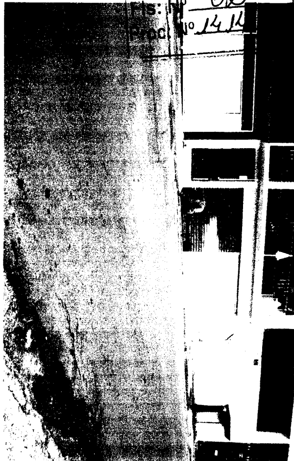
RUA DORA, Nº 200 - Pq. DOS CAMARGOS