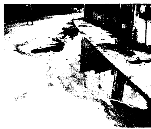
Avenida Iracema entre os n ºs 620 e 654