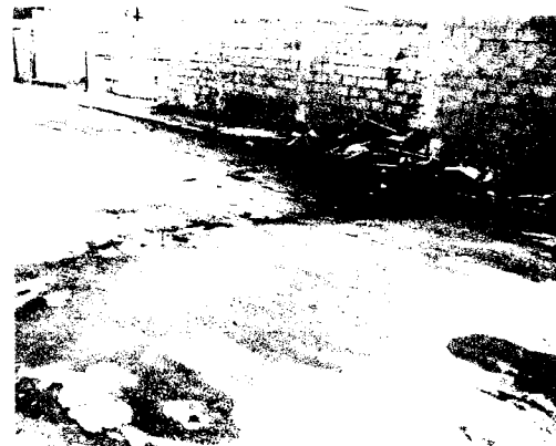
Avenida Iracema esquina com Rua Dr. Danton Vampré