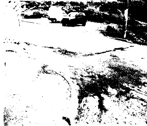
Avenida Iracema esquina com Rua Eng. Cezar Polillo