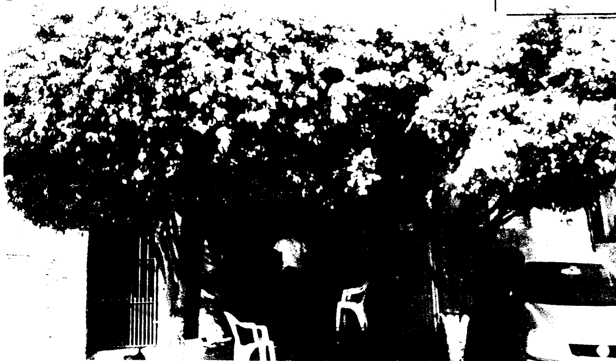
Rua Maysa, nº 194 – Parque dos Camargos