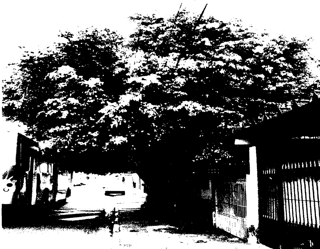
Rua Presidente Kennedy, nº124 – Jardim Audir