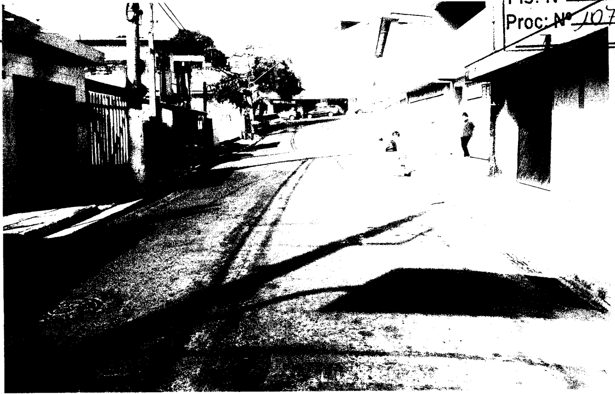
Rua Adhemar P. Barros, em frente nº 15 – Jardim Itaquiti