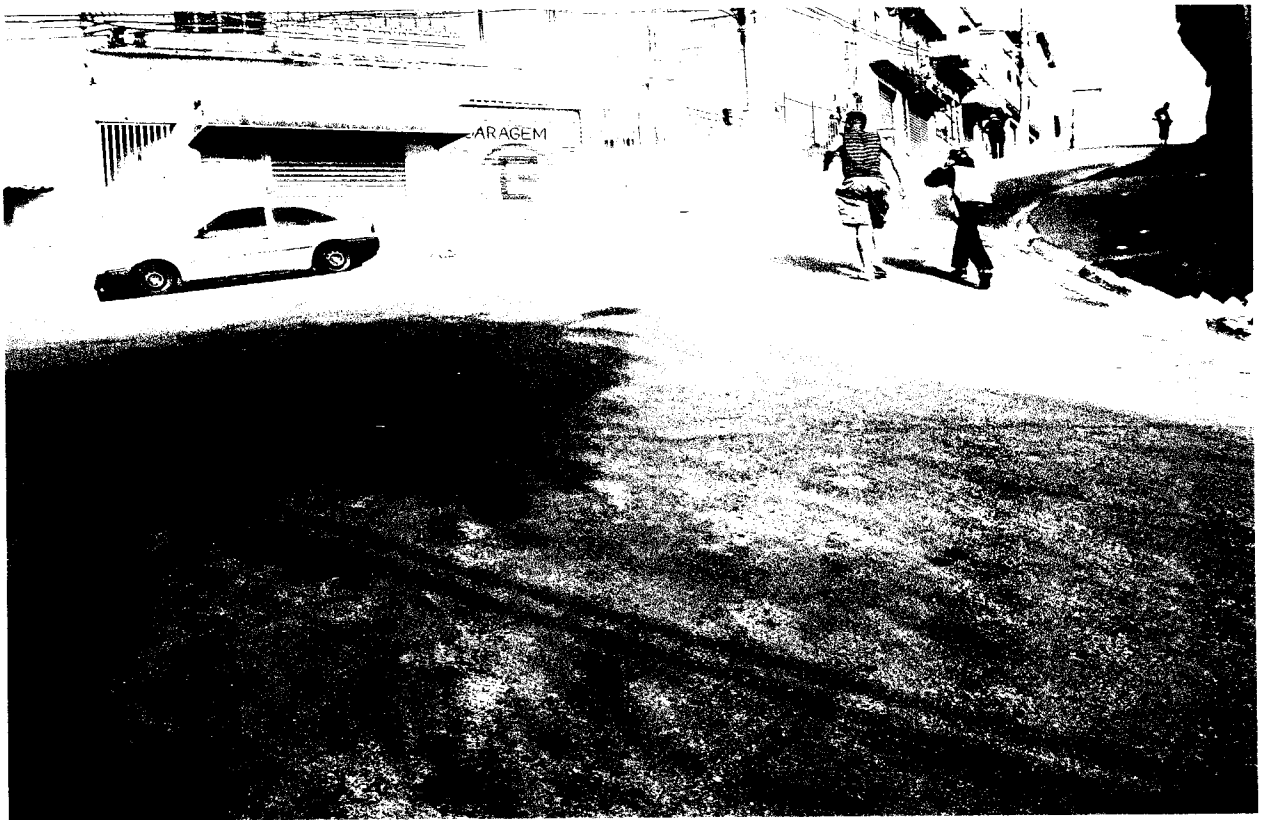
Rua João Goulart, altura do nº 414 – Jardim Itaquiti