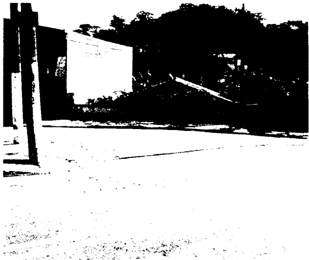
Esquina das Ruas Vitória com Santa Úrsula, no bairro Vila São Jorge