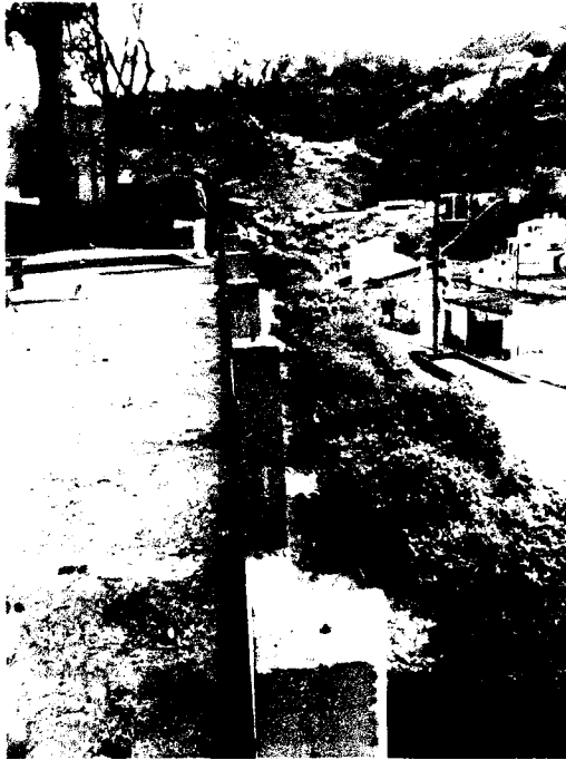
Muro na Praça Manusa, início da Rua Julio Prestes com a Rua Getúlio Vargas, no bairro Jardim Belval