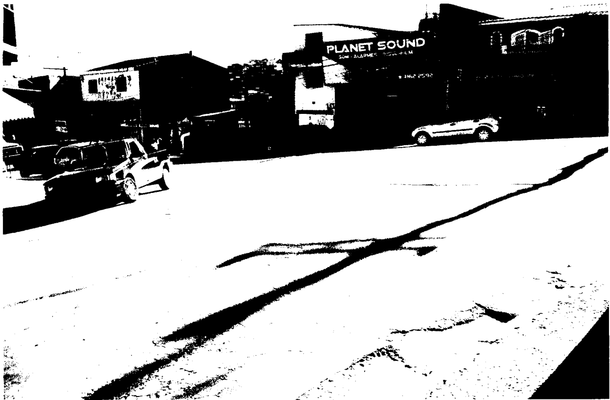
RUA MARCIA COM AV. ZELIA – PARQUE DOS CAMARGOS