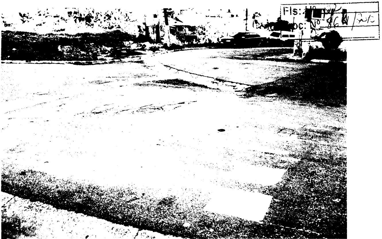
RUA NELLY MASSIEIRO FERNANDES COM AL. ROTTERDAM –RECANTO PHRYNEA