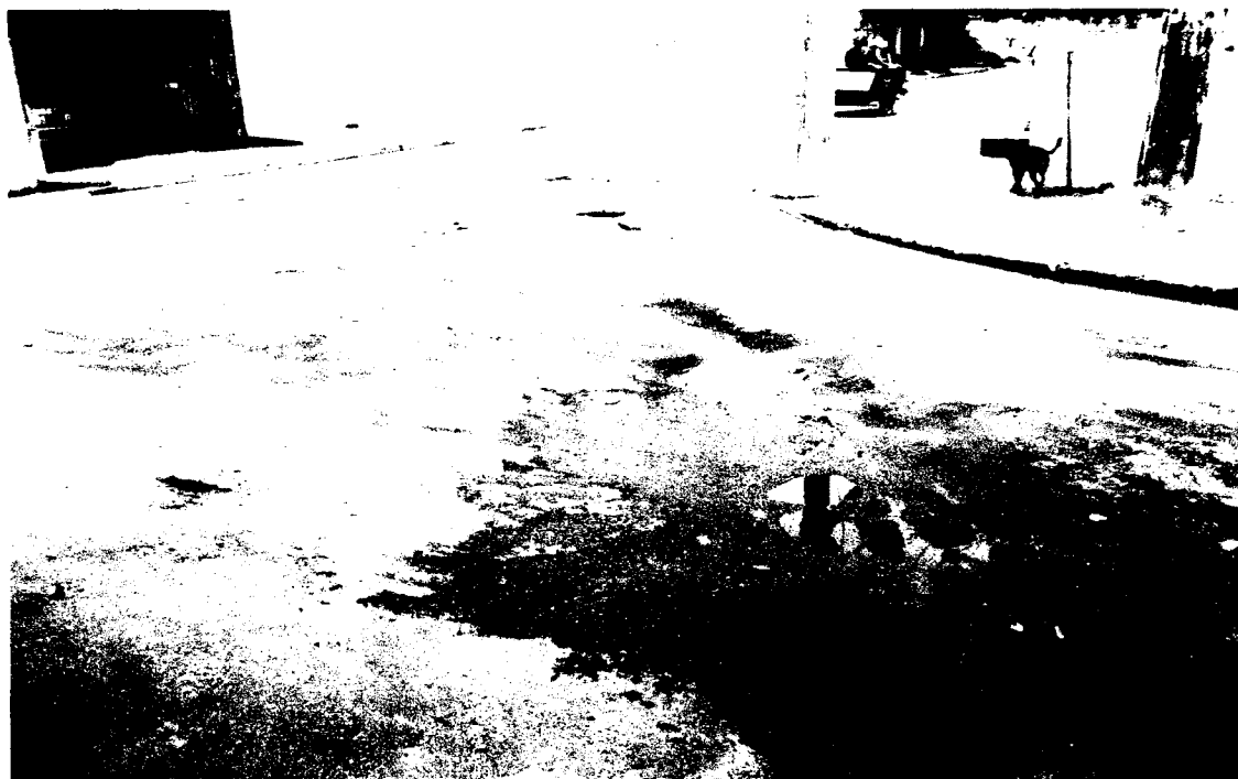
RUA ELISABETH COM A RUA VERA – PARQUE DOS CAMARGOS