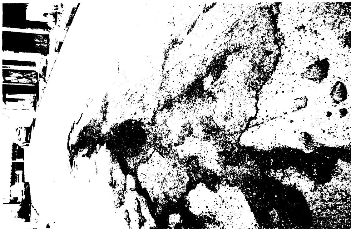
ENG° JONAS POMPÉIA, ALTURA DO N°55 – JD. SILVEIRA