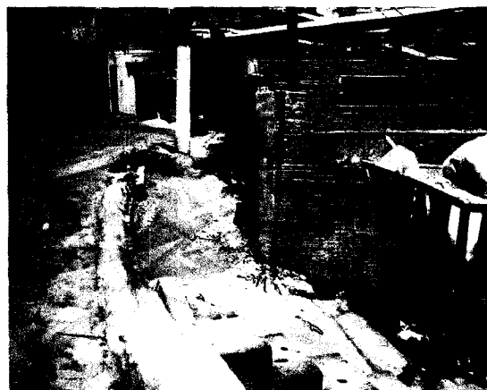
Rua Munique, n.º 152 e n.º 187 barranco caiu causando deslocamento das guias.