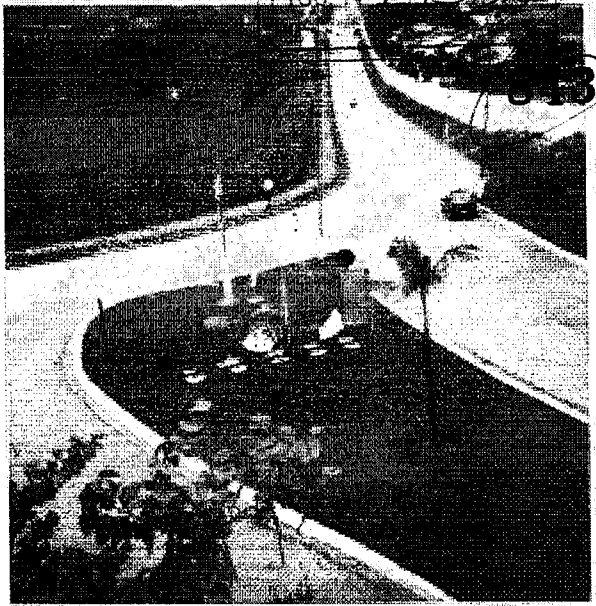
Av. Pádua Velho s/ Av. Mackenzie