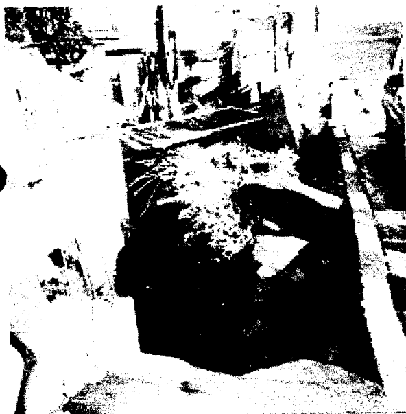
ESTUDIO JACOBS 16