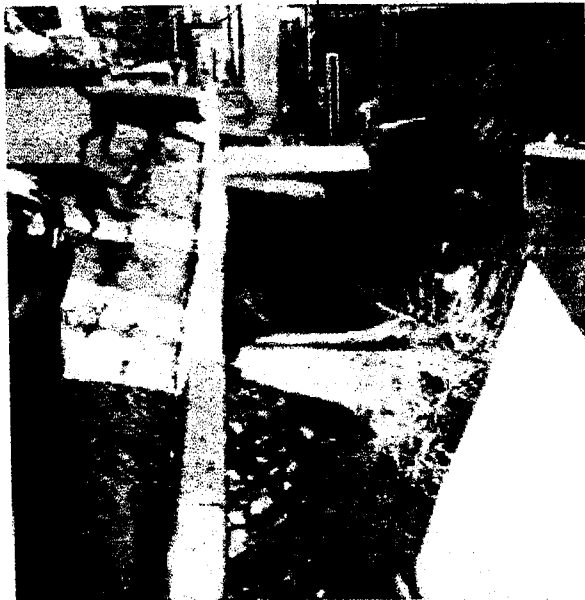
ESTUDIO JACOBS 16