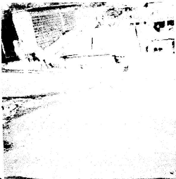
ESTUDIO JACOBS 16