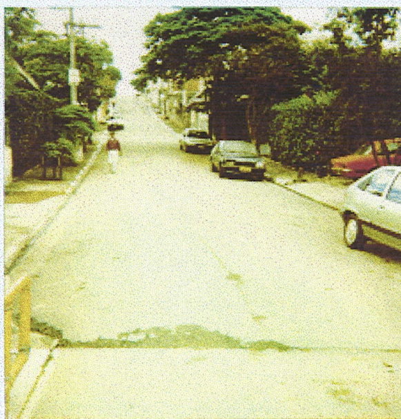
Rua Arnaldo, Endo Novo. Caracate