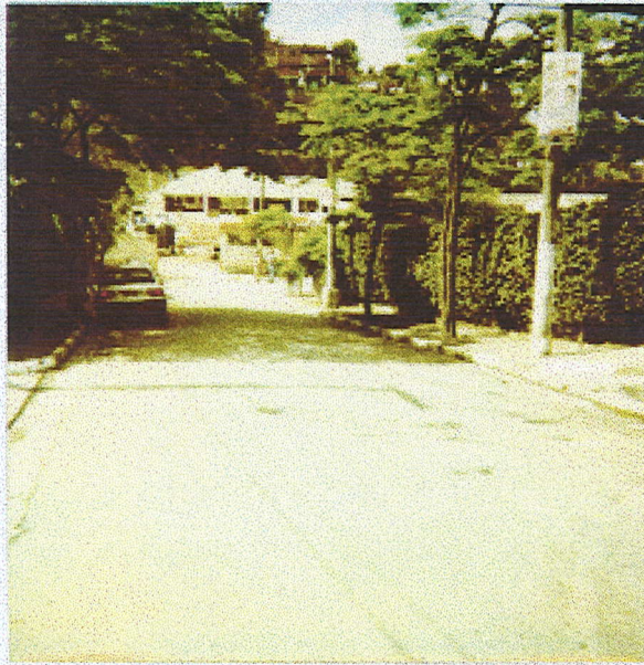
Rua principal - Quilombo Lindópolis. cavalante