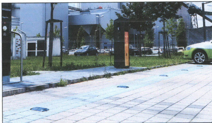
Estacionamento na cidade de Dresden, Alemanha.

ANEXO À INDICAÇÃO QUE DISPÕE SOBRE: Instalação de sensores no estacionamento público localizado no bulevar, centro de Barueri.